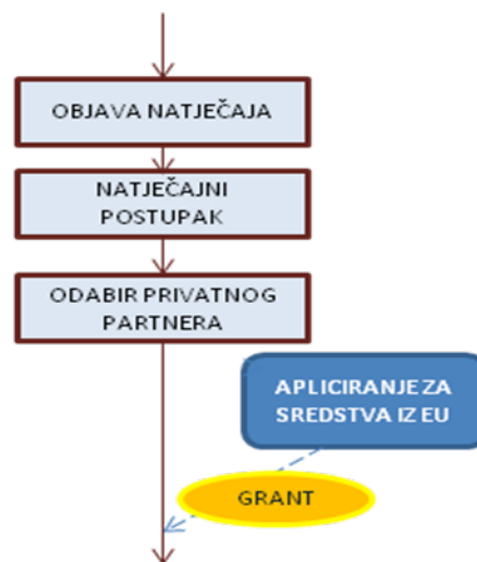
Shema 2 – APLICIRANJE ZA EU SREDSTVA NAKON POSTUPKA JAVNE NABAVE

procijeniti ekonomske i financijske kriterije projekta (troškove i prihode na projektu) . Isto tako, ova opcija se često koristi, kao način izbjegavanja rizika ponovnog podnošenja zahtjeva za odobravanjem EU sredstava zbog izmjena projektnih troškova i iznosa nužnih sredstava EU fondova koji proistječu iz postupka odabira privatnog partnera.